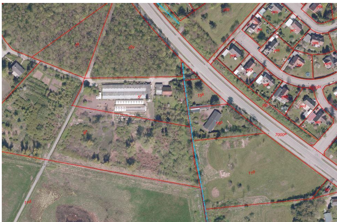
Luftfoto 2018. Matrikler med røde linjer og Bækrenden med blå stiplede linje.

Ejendommen ligger i landzone og placeringen i forhold til omgivelserne fremgår af nedenstående luftfoto.